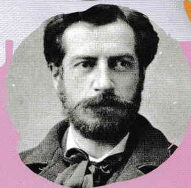
Frédéric Auguste Bartholdi